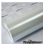
ECH01 - Satin Pearl White