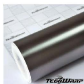
ECH02 - Gunsmoke Grey