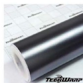
ECH03 - Charcoal Grey