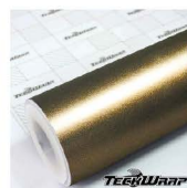
ECH17 - Bond Gold