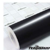
ECH21 - Dark Platinum